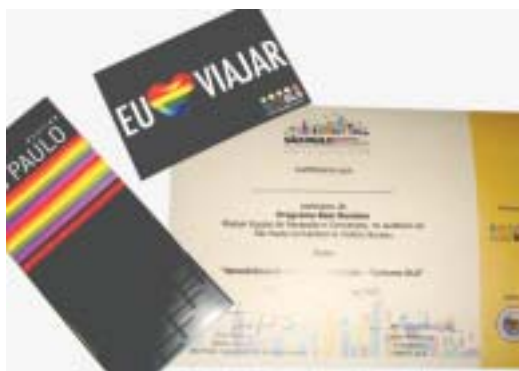
MATERIAL UTILIZADO DURANTE TREINAMENTO AO PÚBLICO GLBT E O CERTIFICADO ENTREGUE AOS PARTICIPANTES

ministradas, nas dependências da instituição, por professores universitários indicados pela Associação Brasileira de Bacharéis em Turismo (ABBTUR).