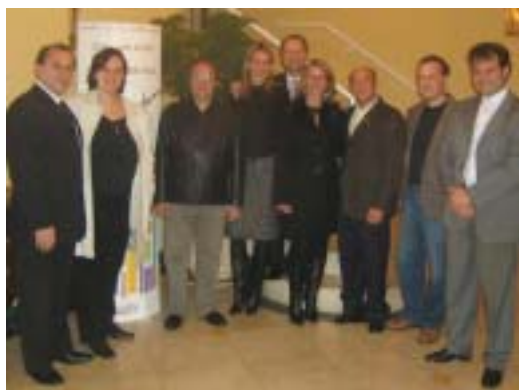
REPRESENTANTES DO SPCVB E PARCEIROS DO PROGRAMA BEM RECEBER DURANTE A FORMATURA DA SEGUNDA TURMA DE TAXISTAS

No mês de maio, 50 motoristas de táxis celebraram a formatura na segunda fase do Programa Bem Receber – Módulo Taxistas, em evento nobre no Terraço Itália. No fim de julho, a entidade concluiu oficialmente o primeiro semestre do programa com 180 motoristas que atuam em cooperativas, táxis de luxo e táxis comuns. Na ocasião, as quatro últimas turmas participantes dos treinamentos foram diplomadas. Realizada em parceria com a Faculdade Cásper Líbero, a segunda etapa contou com três módulos e aulas