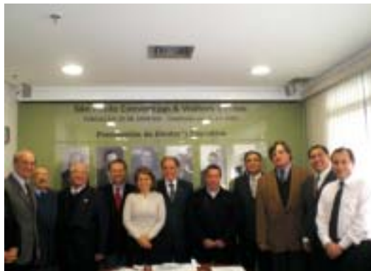
A DIRETORIA DO SPCVB RECEBEU A PRESIDENTE DA EMBRATUR NA SEDE DA FUNDAÇÃO