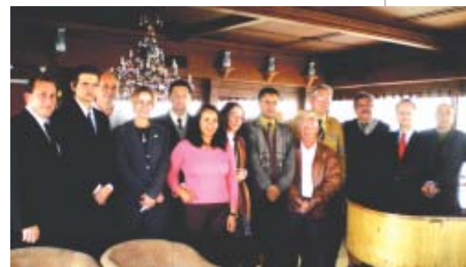
PARTE DOS FORMANDOS DA ÚLTIMA TURMA DE TAXISTAS CERTIFICADOS EM JULHO, ACOMPANHADOS PELA EQUIPE DO SPCVB E PELOS PARCEIROS DO PROGRAMA