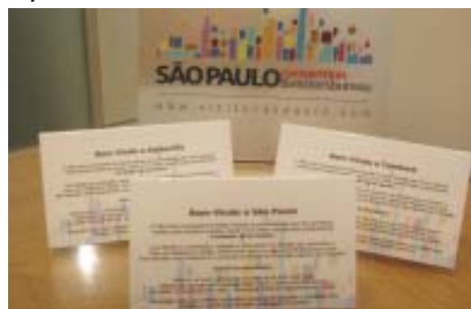
Displays visíveis aos hóspedes