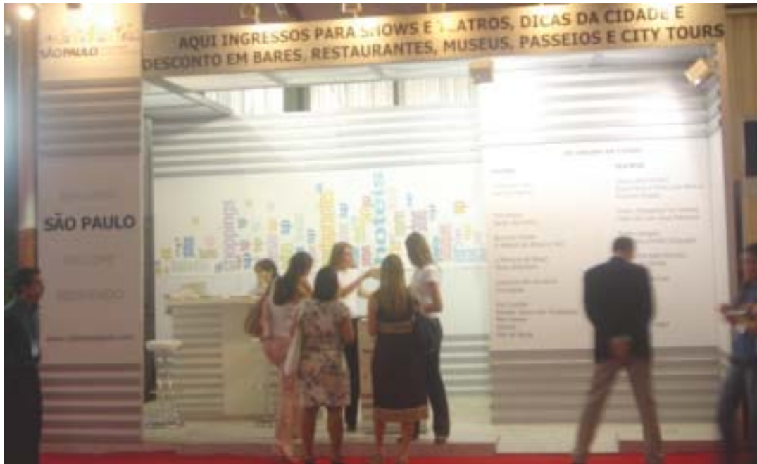
Estandes do Bem Receber estão nas principais feiras e congressos da cidade

Programa oferece facilidades e benefícios aos visitantes de feiras de negócios